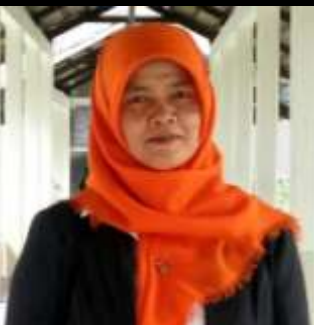
BETNANELLY Kasubag Data & Program