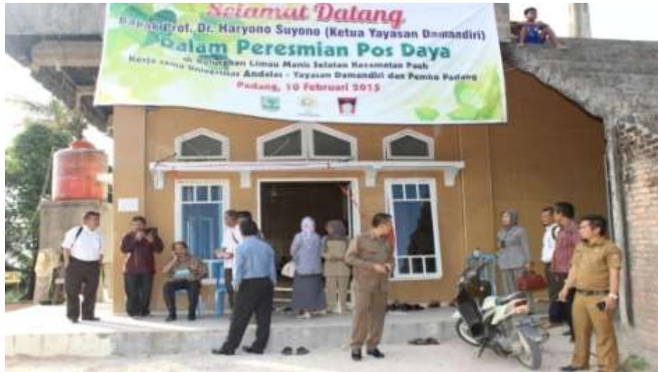
foto 1. pengabdian dalam peresmian pos daya di kelurahan Limau Manis Kecamatan Pauh